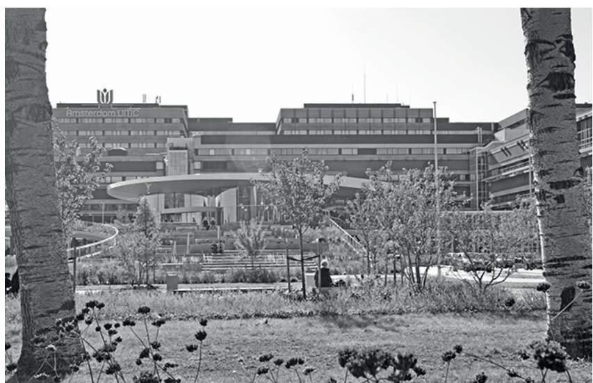
De artist's impression is werkelijkheid geworden!

Een uitstapje erheen raden we iedereen aan. Niet alleen om het nieuwe entreegebied te zien, maar ook voor het oude gebouw met zijn bijzondere binnenpleinen met - voor Zuidoost uitzonderlijk