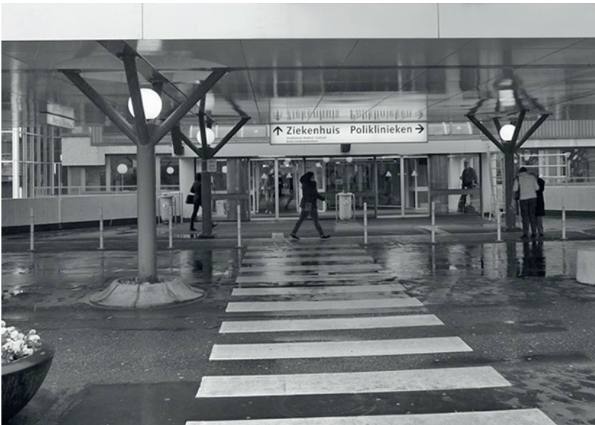
Hoofdingang AMC in 2016

onderzoek en onderwijs. Ook dat was bijzonder.