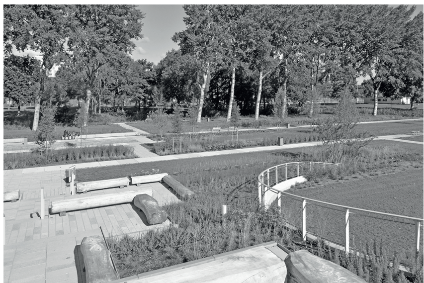
Park gezien vanaf de tribune

parkgebied beneden, maar bezoekers die goed ter been zijn kunnen ook via de brede trap buiten naar het park afdalen. Hier zijn overal zitplekken, de trap kan ook dienen als tribune bij een hoorcollege, een theaterstuk of een