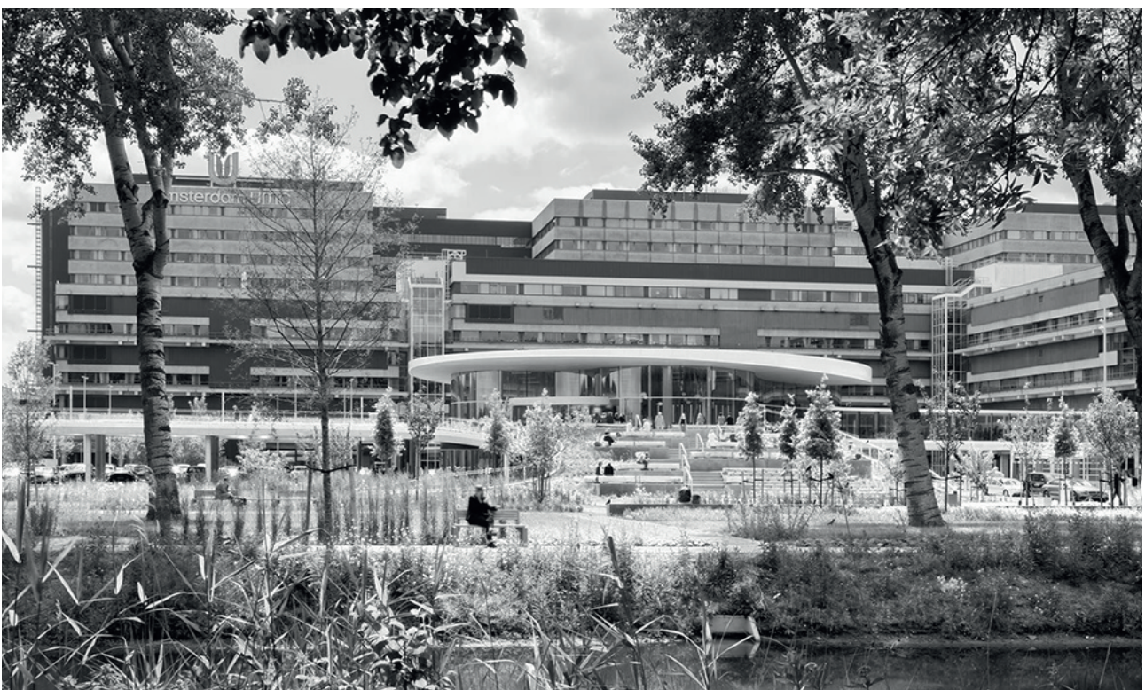
Artist's impression AMC HEALTH PARK, 2017

De opdracht voor de prijsvraag luidde kort gezegd: ontwerp een hoofdingang die een warm welkom biedt, en die ook in een gezonde, groene omgeving staat. Met die nieuwe entreepartij wil het AMC een 'obstakelvrije verbinding' maken tussen de openbare binnenruimte en een groen en parkachtig voorgebied op de plek van de vroegere parkeerplaats. Dit moet kunnen fungeren als verblijfsruimte voor patiënten, bezoekers, studenten en medewerkers van het AMC. En vanzelfsprekend ook voor