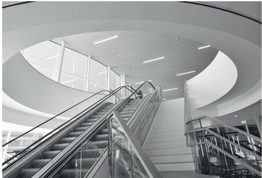
Roltrappen in het paviljoen

Maar al met al is het nieuwe entreegebied een enorme verbetering: de medische kolos staat nu met een mooie en duidelijk herkenbare hoofdingang in een groene omgeving, die het gebouw op een vanzelfsprekende manier verknoopt met de metro en Amstel III. En: er is geen enkel ander park in Amsterdam met zoveel zitgelegenheid.