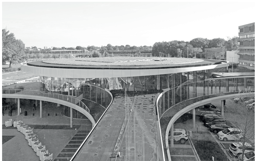
Paviljoen vanuit de poliklinieken