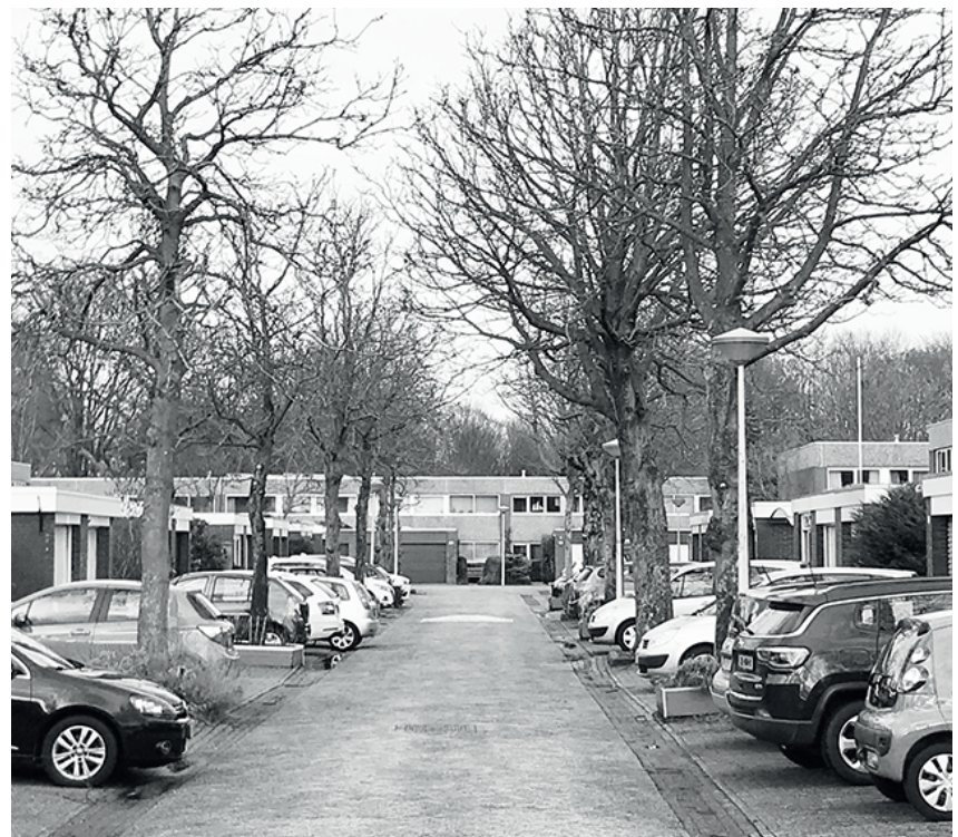
Parkeerbeeld in Geerdinkhof

erover eens dat we voldoende drempels in de toegangsweg hebben liggen. En dat het karakter van de wijk Geerdinkhof met zijn woonerven zonder stoepen behouden moet blijven