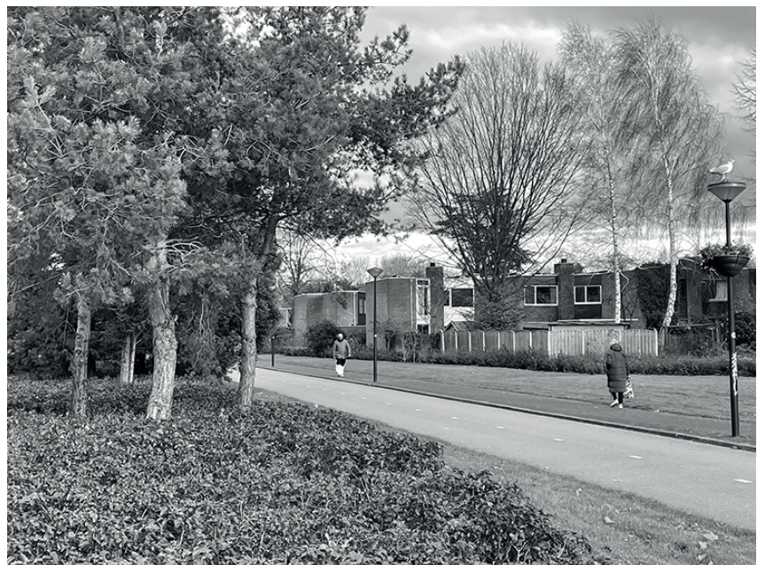
Geerdinkhof hecht sterk aan zijn groene karakter!

Groen en natuur zijn voor de bewoners van Geerdinkhof van groot belang. Velen zijn hier juist vanwege het vele groen gaan wonen. Niet vreemd dus dat er een grote meerderheid (meer dan 90%) is voor het herstel van be-