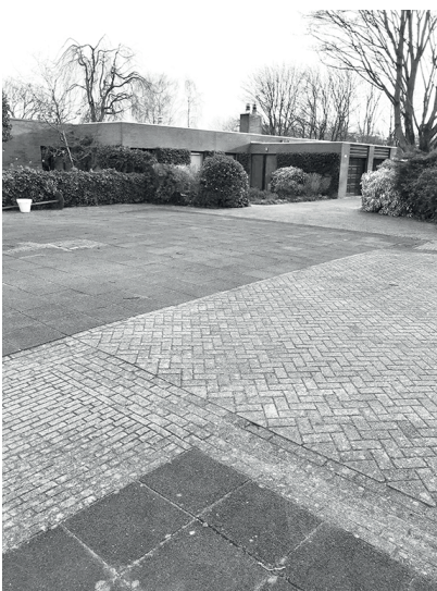
Bestrating met tegels en met klinkers; wat bepaalt het onderscheid?

De overgrote meerderheid van de bewoners wil dat de verkeersopstoppingen bij de scholen aangepakt worden: dit lijkt ergernis nummer één te zijn. Ook is een meerderheid het