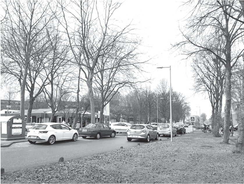
Altijd een verkeers-chaos bij het aangaan en uitgaan van de school

grofvuil er mag staan. Het vaker legen van containers en het beter schoonhouden van de locaties, ook die voor grofvuil, is een veel genoemd aandachtspunt. Voor het scheiden van alle afval aan huis is weinig animo; zoals het nu geregeld is met het legen van één afval-kliko dicht bij huis moet het blijven; het gemak dient de (seniore) mens! Hoewel voor sommigen een aparte kliko voor met name gft wel een optie is.